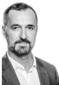
Hvad nu, Frederik?