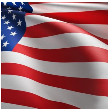
Polarisering i amerikansk politik