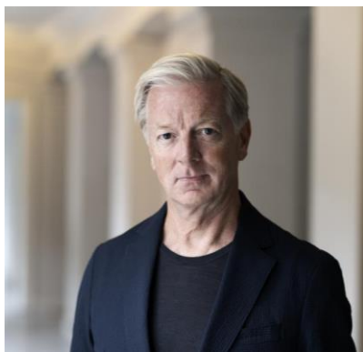
I orkanens øje