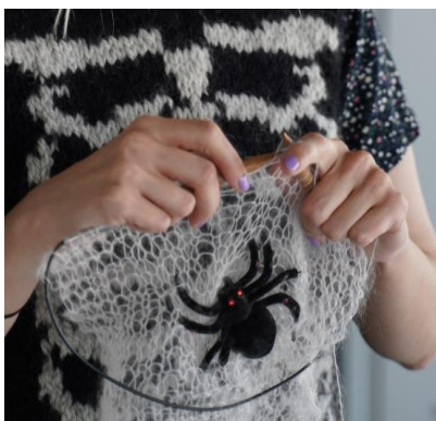
Strik og Rædsel