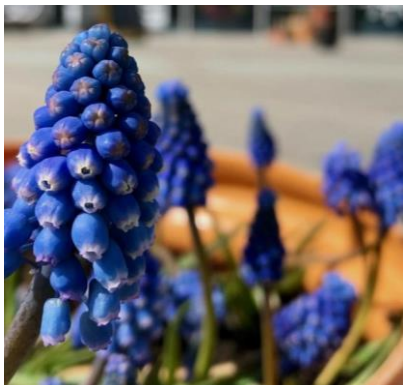
Grønt aktivitet i Tilst