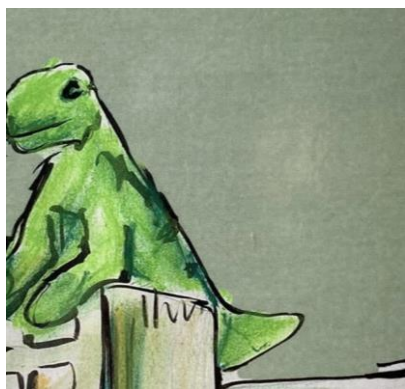
Forfatterforedrag med Thea Berg